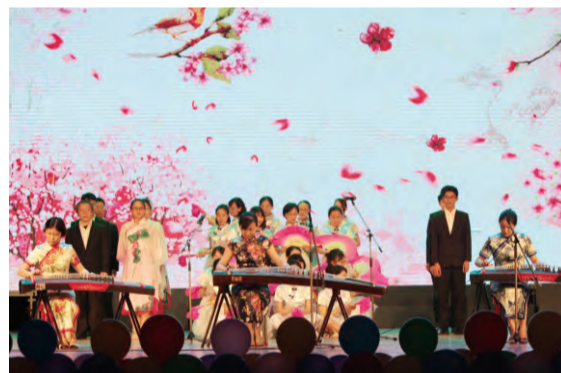
人力资源部、管理学院、发展研究院 表演心歌《好一个幸福家》