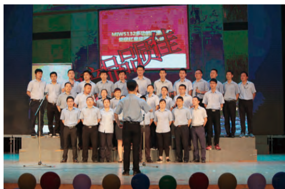
品质保证部表演心歌《我为品质献青春》