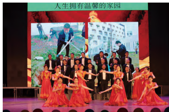
总裁办、审计监察部表演心歌《海洋王颂》