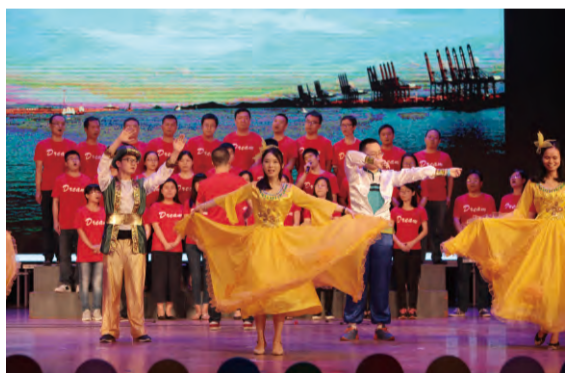
市场部表演心歌《我们的梦》