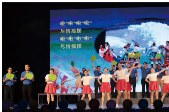
管理优化部、TQM推进部表演心歌《在美丽的海洋王》