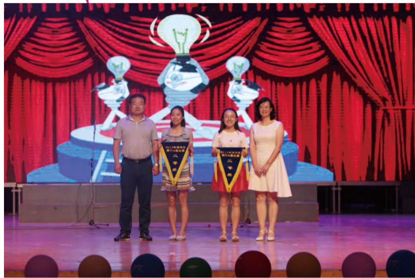
公司领导为总部心歌比赛获得“二等奖”的团队颁奖