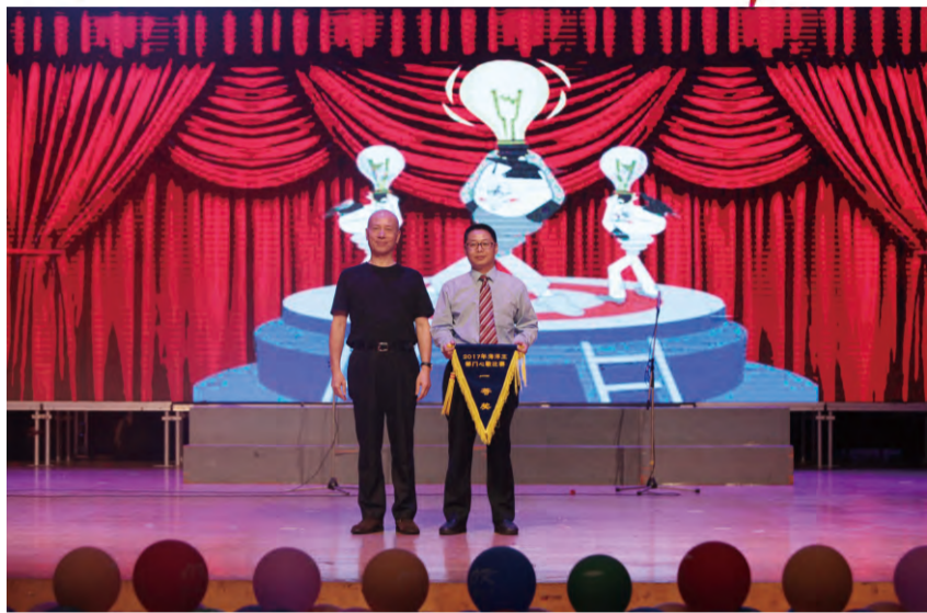
董事长为总部心歌比赛获得“一等奖”的团队颁奖