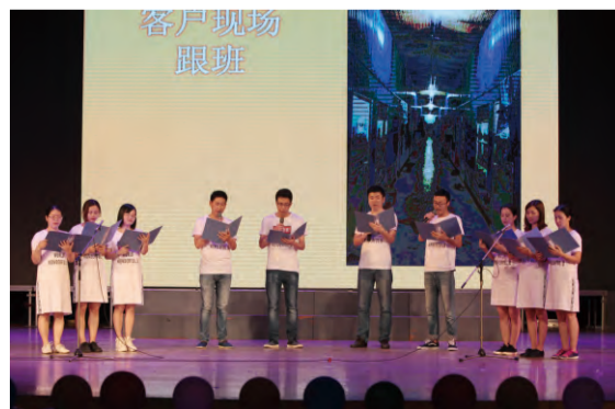
国际部表演心歌《Tomorrow will be better》