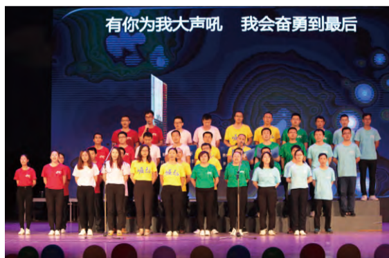
技术与设计部表演心歌《崛起》