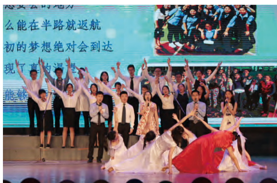
财务部表演心歌《最初的梦想》